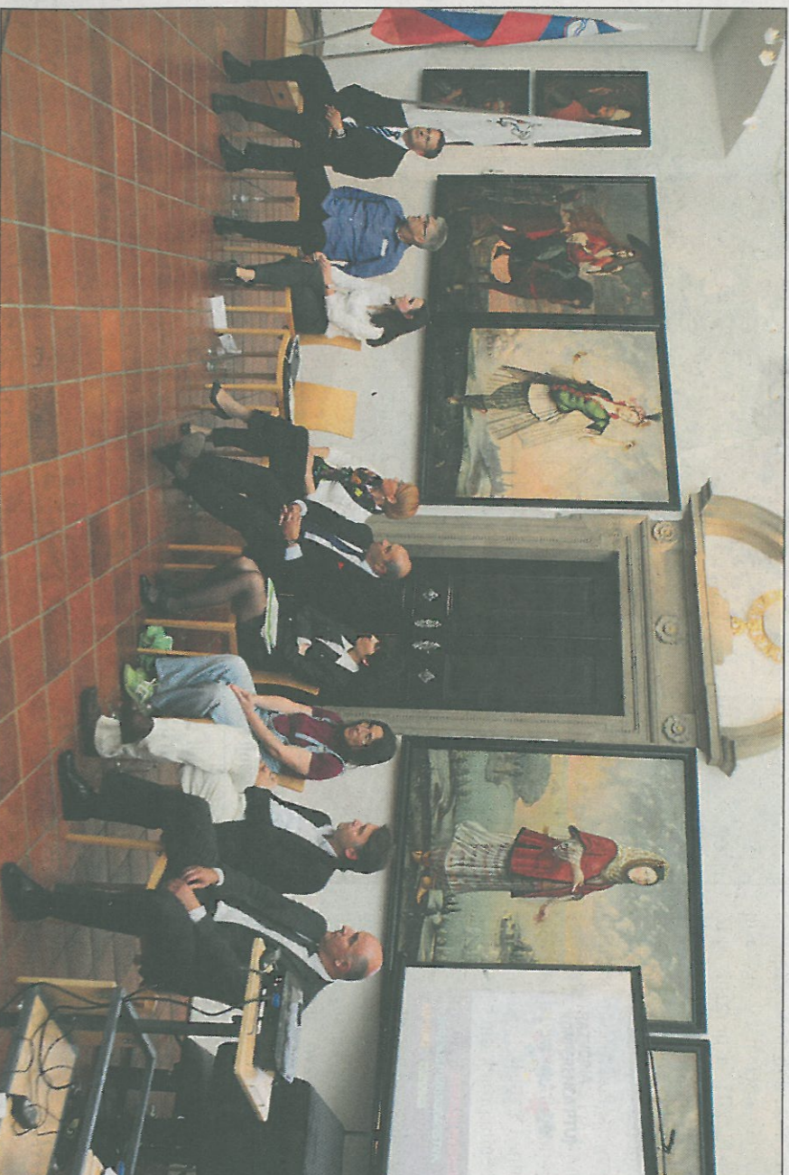
V slavnostni dvorani Ptujškega gradu so razpravljali na temo Razvoj Ptujja predstavlja sinergijo pričakovani in zmožnosti gospodarstva, kulture in turizma.