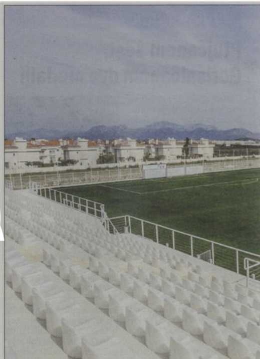
Trening kompleks v Turčiji

V Kidričevem se je pred nekaj leti pripravljala tudi slovita Valencia; nastanjeni so bili v hotelu Primus na Ptuju.