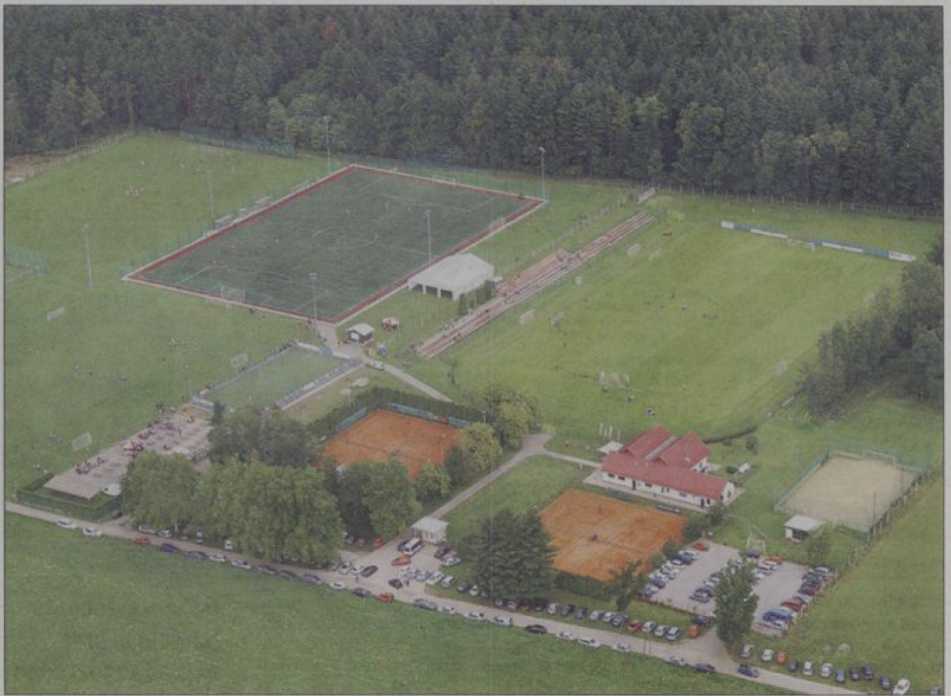
Vzorno urejen trening kompleks v Kidričevem se lahko brez težav primerja s tujimi.